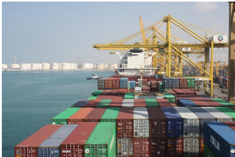
杰贝阿里集装箱码头

哈利法港，为阿布扎比最大的商业港口，目前一期已完工。项目第一阶段包括具有年处理200万20英尺标准箱能力的港口和面积51平方公里的工业区A区。哈利法港已取代扎耶德港成为阿布扎比的主要货运港。目前，哈利法港口吞吐量为250万标箱和1200万吨一般货物。中远海运码头公司于2016年9月获得二期码头35年特许经营权2018年12月10日，中远海运港口阿布扎比码头正式开港。2019年5月，中远太阳轮和双鱼座轮两艘可载两万标箱以上的超大巨轮相继停靠中远海运阿布扎比码头。