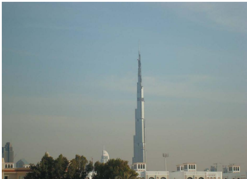
世界第一高楼——哈利法塔