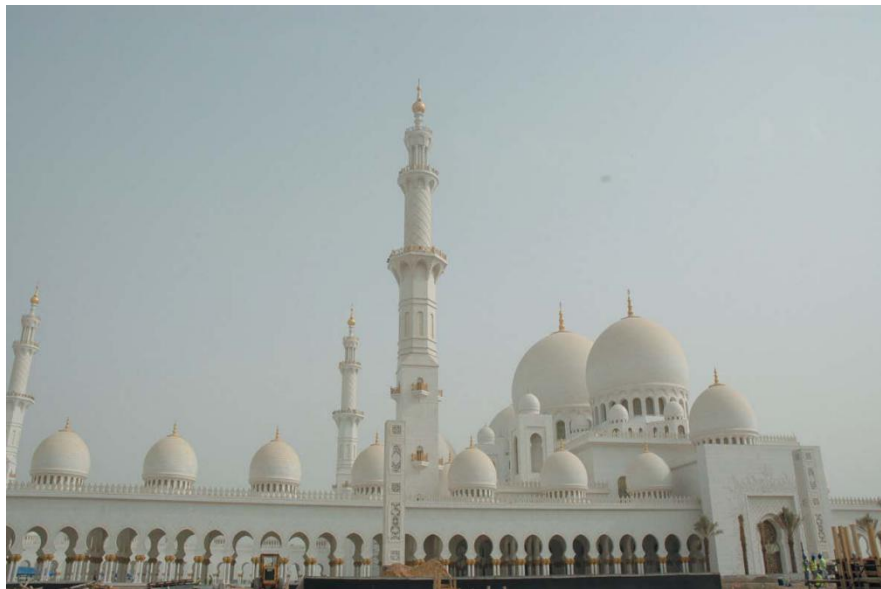
谢赫扎耶德清真寺

(5) 阿联酋人性格粗犷奔放，热情好客，习惯以茶和咖啡待客，格外喜爱甜点。客人落座后，端上来的除了茶、咖啡，还会有甜点、巧克力或椰枣。