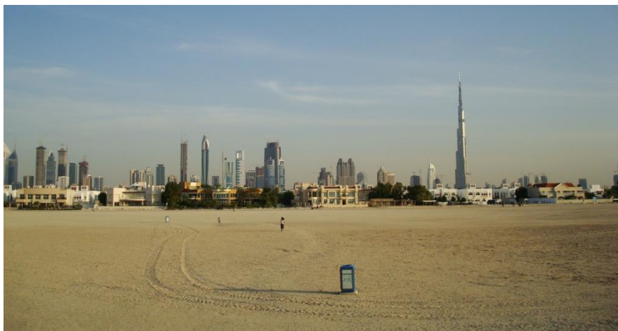
迪拜中央商务区远眺

世界经济论坛《2019年全球竞争力报告》显示，阿联酋在全球最具竞争力的141个国家和地区中，排第25位。