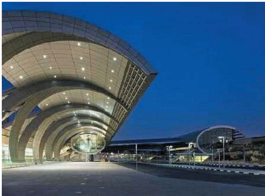
迪拜国际机场T3航站楼外景