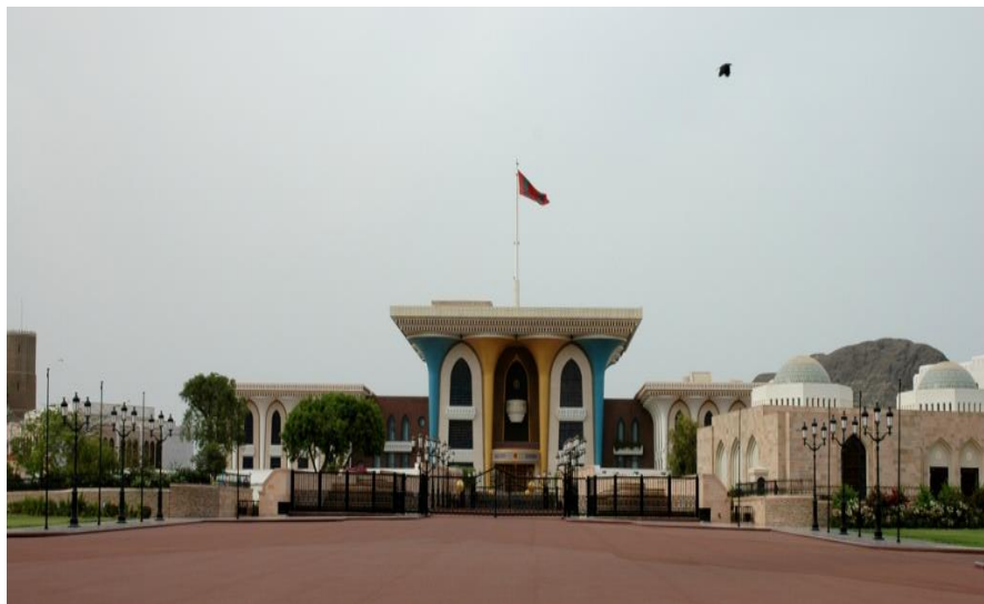
旗帜宫—苏丹重大礼仪活动地

其他较大的城市还有苏哈尔(Sohar)、苏尔(Sur)、萨拉拉(Salah)、尼兹瓦(Nizwa)等。