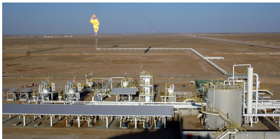
中石油阿曼5区块作业现场

【双向投资】据中国商务部统计，2019年中国对阿曼直接投资流量-315万美元；截至2019年末，中国对阿曼直接投资存量1.16亿美元。重点投资项目主要有：中石油阿曼5区块项目，2019年8月合同延期15年；国家电网收购阿曼电网49%股权；中阿（杜库姆）产业园一期，预计于2021年建设完成；江苏常宝钢管股份有限公司油井管加工线于2018年10月竣工投产，投资金额2000万美元；沈阳华氏食品饮料有限公司投资设立阿曼塑料有限公司，建设饮料包装厂，预计投资金额1亿美元；河南正佳能源环保股份有限公司计划投资2000万美元建设聚合物工厂，已进入建设阶段。2019年当年，阿曼无对华直接投资，截至2019年末，项目数量4个，阿曼在华投资1922万美元。阿曼石油公司与韩国GS集团签订协议，购买了青岛丽东化工有限公司30%的股份。