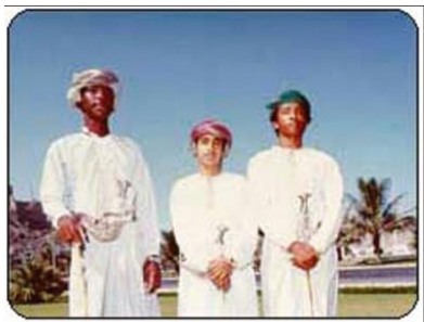
阿曼人的正式着装

【服饰】阿曼男子虽与大多数阿拉伯人一样穿无领长袖大袍、戴头巾，但有明显的不同：一是袍子的领口右侧垂有花穗，可以蘸注香水；二是头巾质地讲究，有很漂亮的花纹，扎缠在头，与沙特等国不同。在正式场合，男子一般习惯穿无领长袍，扎缠头巾，佩带弯刀（Khanjar），脚穿露出脚趾的皮凉鞋。妇女喜饰金，服装艳丽。阿曼人能歌善舞，不过一般都是女歌男舞，男人在圈中欢快地跳舞，妇女则在外面以拍手唱歌伴舞。