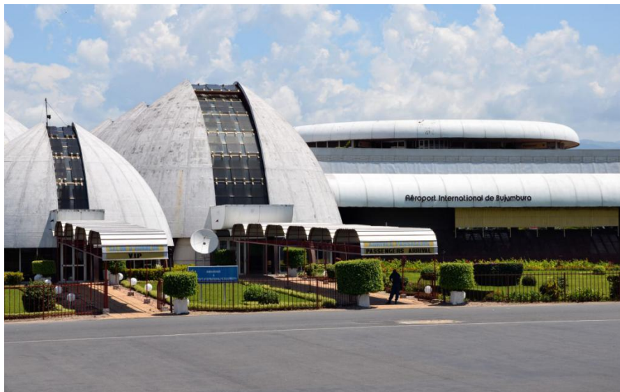
布隆迪布琼布拉国际机场

航)、比利时布鲁塞尔航空公司、卢旺达航空公司、坦桑尼亚航空公司、乌干达航空公司。其中,坦桑尼亚航空与乌干达航空为新设立的航线。中国去往布琼布拉一般需经埃塞俄比亚首都亚的斯亚贝巴,或者肯尼亚首都内罗毕等地中转。