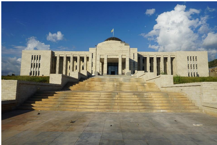
援布隆迪总统府项目（湖南建工承建）

月后，正式宣布根据《科托努协定》第96条款规定，暂停对布隆迪政府的财政援助，该计划包括终止欧盟与布隆迪政府的所有合作计划，以及所有可能为布隆迪政府提供资金的援助行动，但保留对布方人道主义援助和与当地非政府组织直接合作的项目。同时，欧盟方面称将继续保持与布隆迪政府的对话渠道，并根据布隆迪国内各派政治对话的具体实施和有关进展，每隔六个月审议一次该制裁措施。继比利时、荷兰、美国决定停止对布隆迪援助后，欧盟这一决定无疑将严重打击布隆迪经济发展。