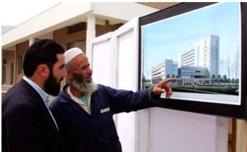
喀布尔共和国医院

阿富汗每年进口大约价值8千万美元的药品，另有大部分通过非法渠道进口。阿富汗公共卫生部正在筹划建立国家医药公司，以进口合格药品并防止恶性竞争。同时，阿富汗公共卫生部也正计划在喀布尔、赫拉特、巴尔赫、楠格哈尔、霍斯特、坎大哈省等地成立药品和食品控制中心，以检测从国外进口的药品和食品质量。目前，阿富汗国内仅喀布尔有一家药品和食品控制中心。