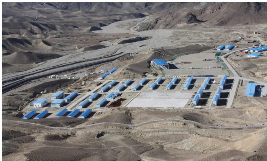
中冶江铜埃纳克铜矿项目营地