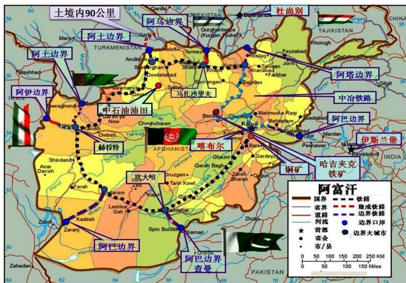
阿富汗铁路规划示意图（2011年）

大规模铁路建设面临三大问题。一是铁路轨距问题。中亚地区轨距是1524mm，伊朗是1435mm，巴基斯坦及其他南亚国家是1676mm。阿富汗铁路网采用哪种轨距，有待于阿富汗作出裁决。二是建设可行性问题。当前阿富汗国内市场运量和地区转运量还不足以支撑庞大的区域铁路网络的运行。三是资金来源问题。铁路投资巨大，需与国际社会采取多途径、多方式联合修建的方式。