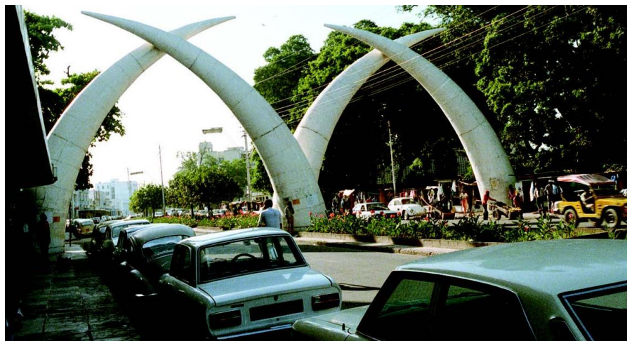
肯尼亚蒙巴萨市中心