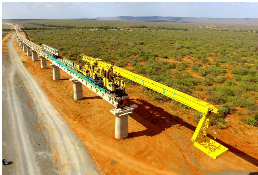
中国路桥蒙内铁路项目架梁施工