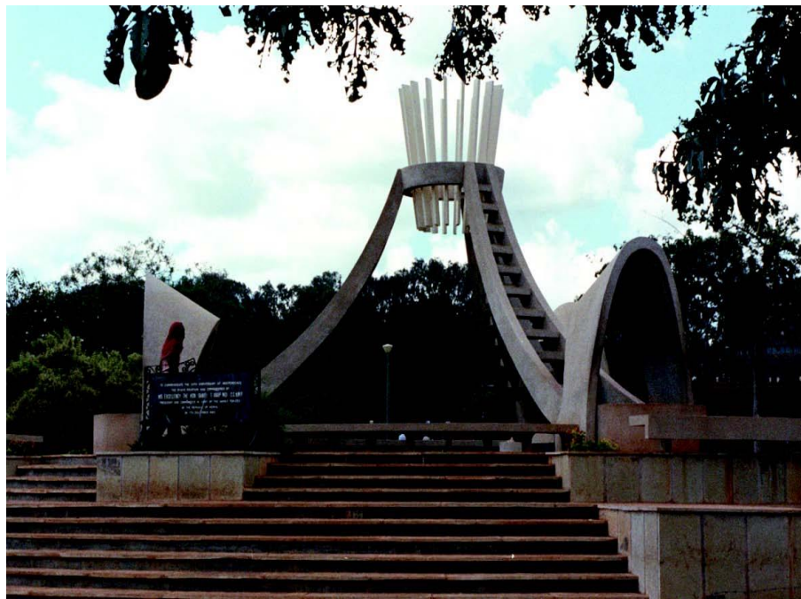
肯尼亚独立纪念碑

【总统和内阁】肯尼亚实行总统内阁制，总统为国家元首、政府首脑兼武装部队总司令，由直接普选产生，每届任期5年。2017年11月28日，乌胡鲁·肯雅塔宣誓就职，成功连任。内阁由总统和总统任命的副总统、各部部长以及总检察长组成。本届内阁成立于2018年2月，肯尼亚总统于2020年1月改组内阁改组后的内阁包括总统、副总统、各部部长共24名成员。