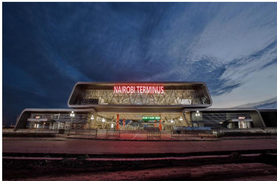
中国路桥蒙内铁路内罗毕终点站

【承包劳务】据中国商务部统计，2019年中国企业在肯尼亚新签承包工程合同120份，新签合同额13.78亿美元，完成营业额41.68亿美元。累计派出各类劳务人员2802人，年末在肯尼亚劳务人员8348人。新签大型承包工程项目包括中国水电建设集团国际工程有限公司承建肯尼亚Mwache多功能大坝项目；中铁建工集团有限公司承建内罗毕商业湾广场项目；华为技术有限公司承建肯尼亚电信项目等。