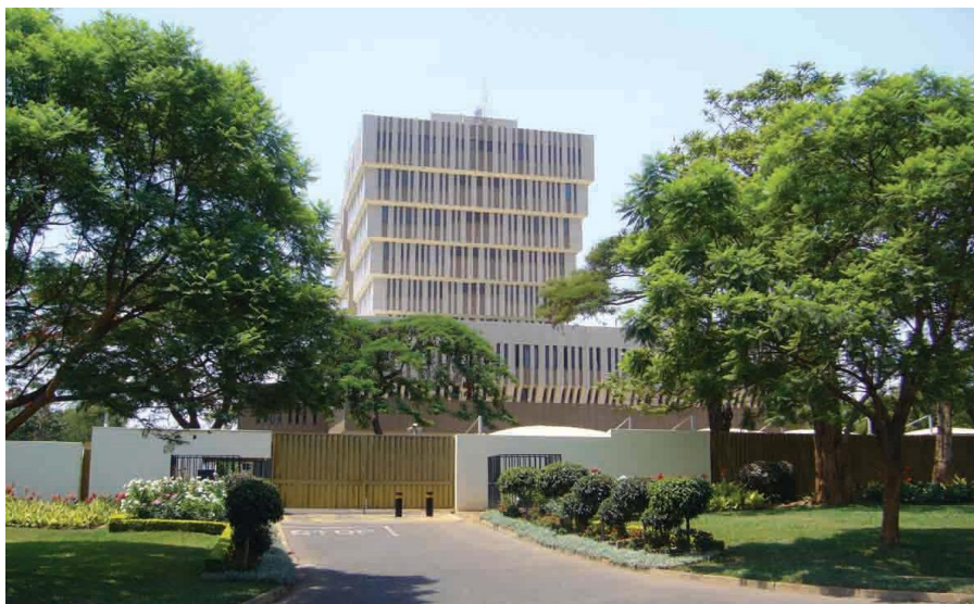
马拉维储备银行总部大楼

马拉维主要商业银行有：马拉维国家银行、马拉维标准银行、马拉维第一商业银行、莱德银行、经济银行、印迪银行和新建筑协会银行等。其中马拉维国家银行（NBM）为马拉维第一大银行，在全国拥有数十家分行和上千名员工。马拉维标准银行为南非标准银行控股的外资银行，是仅次于马拉维国家银行的第二大银行。目前该行与中国工商银行等金融机构有比较密切的业务往来。