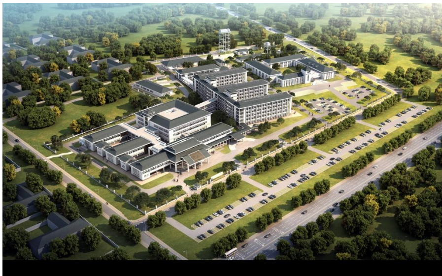
山西建投承建的中国援赞比亚利维·姆瓦纳瓦萨教学医院项目

【援建医院】中国援建的利维·姆瓦纳瓦萨综合医院已于2011年8月移交赞方使用，为赞比亚医疗卫生领域的发展发挥了积极作用。2017年5月，援建医院二期工程开工，将于2020年11月竣工交付使用，建成后住院床位将增至826张。2020年3月，为助力赞比亚抗击新冠肺炎疫情，中国援建医院二期工程实施单位提前向赞比亚政府移交项目。