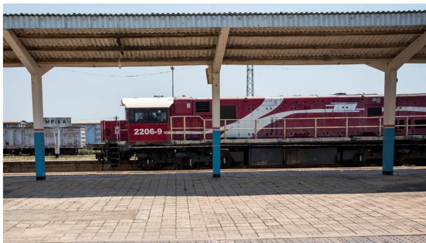
坦赞铁路姆皮卡站-站台火车

通过铁路，赞比亚可连接到非洲7个主要港口，分别是坦桑尼亚的达累斯萨拉姆、莫桑比克的贝拉和纳卡拉港、南非的东伦敦、伊丽莎白港、德班和开普敦。