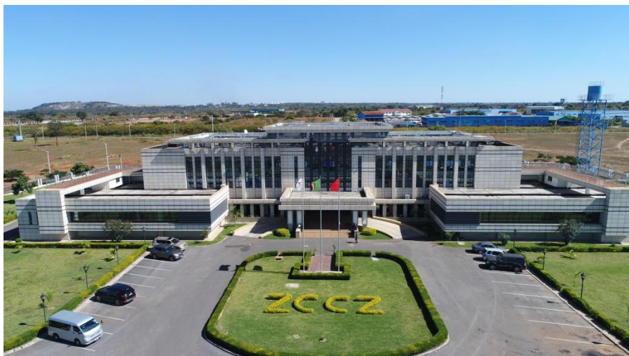
中赞经贸合作区谦比希园区

【承包工程】据中国商务部统计，2019年中国企业在赞比亚新签承包工程合同额22.09亿美元，完成营业额25.75亿美元；累计派出各类劳务人员3026人，年末在赞比亚劳务人员8906人。新签大型工程承包项目包括中铁国际集团有限公司承建的赞比亚西北铁路项目1A段；中国建筑集团有限公司承建的赞比亚东部省奇帕塔高尔夫景观商场项目、赞比亚西部省109公里道路体项目；中国江苏国际经济技术合作集团有限公司承建的援赞比亚国际会议中心项目等。