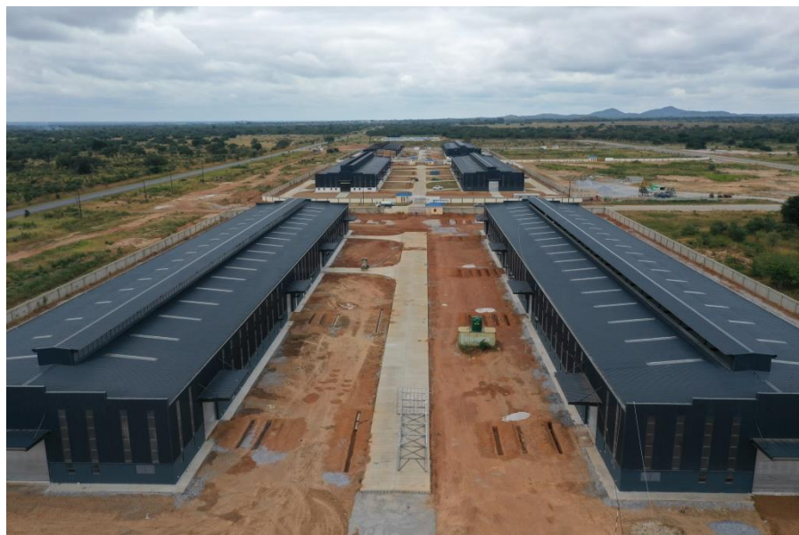
赞比亚江西经济合作区

赞比亚外国投资者并购案例较少，近年来没有中资企业在赞比亚开展并购遭遇阻碍的案例。