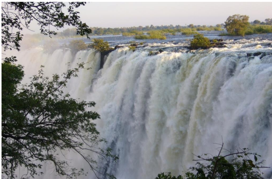
利文斯顿维多利亚瀑布

【建筑业】近年来，道路、机场、水电站以及超市等房建项目陆续开工，拉动了赞比亚建筑业的迅速发展。