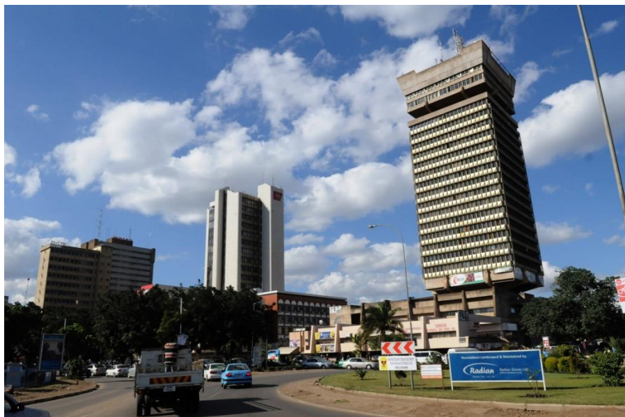
赞比亚卢萨卡市中心