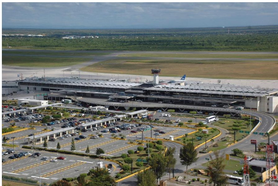
圣多明各美洲国际机场