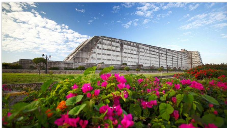
哥伦布灯塔博物馆