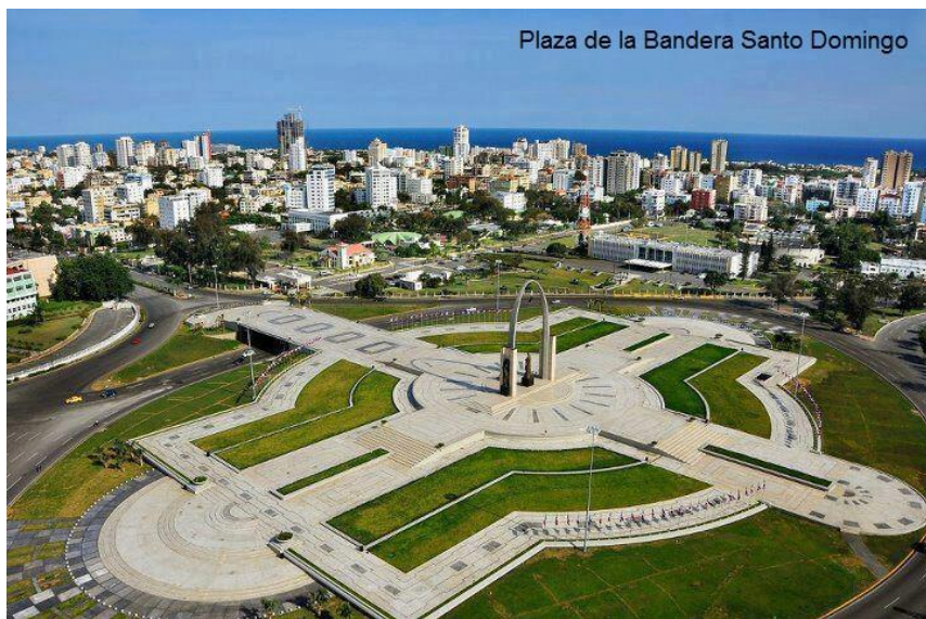
圣多明各国旗广场

多米尼加原为美洲印第安人居住地。1492年哥伦布航行抵达。1496年西班牙人在岛上建立圣多明各城，成为欧洲殖民者在美洲的第一个永久性居民点。1795年归属法国。1809年复归西班牙。1844年2月27日独立，成立多米尼加共和国。1930年特鲁希略发动军事政变上台，实行长达30年的独裁统治。1965年美国出兵占领多米尼加。1966~1978年多米尼加改革党人巴拉格尔执政。1978~1986年革命党人古斯曼、布兰科先后执政。1986~1996年巴拉格尔再次连续执政。1996~2000年解放党人费尔南德斯执政。2000~2004年革命党人梅希亚执政。2004~2012年，解放党人费尔南德斯再度执政并连任。2012-2020年，解放党人梅迪纳执政并连任。2020年7月，现代革命党人阿比纳德尔赢得大选，将于8月16日宣誓就职。