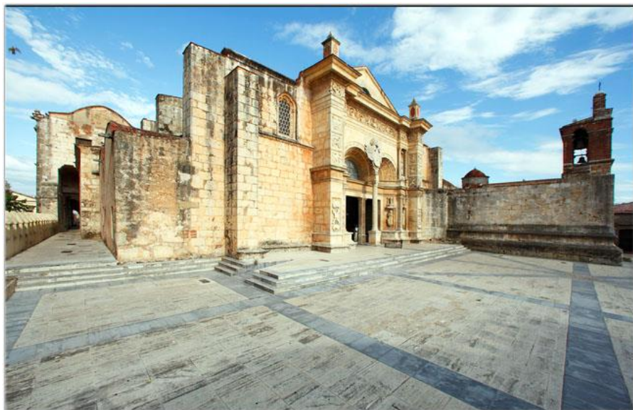
圣多明各美洲大教堂

多米尼加全国划分为31个省和1个国家区，分别是：圣多明各市（国家区）、阿苏阿省、巴奥鲁科、巴拉奥纳省、达哈翁省、杜阿尔特省、埃利亚斯·皮尼亚省、埃尔塞沃省、埃斯派亚省、独立省、阿尔塔格拉西亚省、拉罗马纳省、拉贝加省、玛丽亚·特立尼达·桑切斯省、蒙特克里斯蒂省、佩德尔纳莱斯省、佩拉维亚省、普拉塔港省、米拉贝姐妹省、萨马纳省、圣克里斯托瓦尔省、圣胡安省、圣佩德罗·德马科里斯省、桑切斯·拉米雷斯省、圣地亚哥省、圣地亚哥·罗德里格斯省、巴尔韦德省、蒙赛纽尔·鲁埃尔省、蒙特普拉塔省、阿托马约尔省、圣何塞·德奥科阿省、圣多明各省。省下设市和乡，全国共有155个行政区。