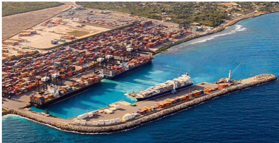
多米尼加高赛多港