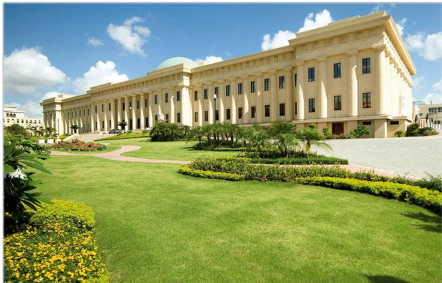
多米尼加国家剧院

【医疗】多米尼加有相对完整的医疗卫生保健网络，公立医院和私立医院和诊所主要集中在省会城市。医疗水平相对较低，各地差距较大。据世界卫生组织统计，2016年全国经常性医疗卫生支出占GDP的5.3%，按照购买力平价计算，人均经常性医疗卫生支出419美元；联合国世卫组织2019年数据显示，人均寿命为73.9岁，根据世界银行数据，2018年多米尼加男性、女性平均寿命均为71岁。