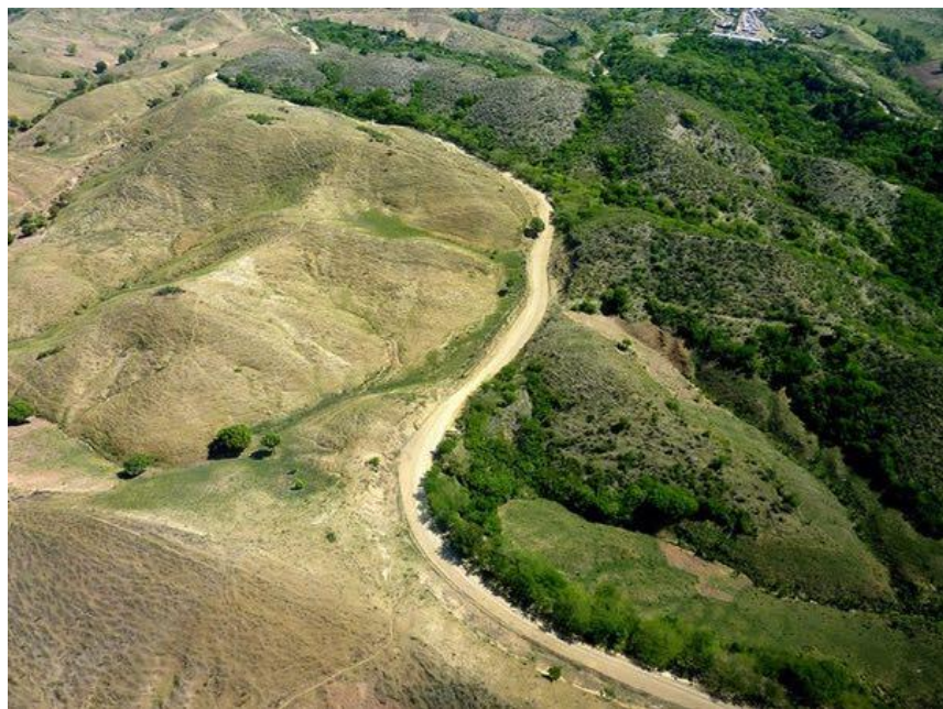
多米尼加与海地之间的边境线

【地理位置】多米尼加位于加勒比海大安的列斯群岛中的伊斯帕尼奥拉岛东部，与海地共处一岛，在西经 68^{\circ}19' 至 72^{\circ}31' 、北纬 17^{\circ}36' 至 19^{\circ}56' 之间，领土总面积为48442平方公里，全国东西向约为390公里，南北向约为265公里。海岸线长1350公里。