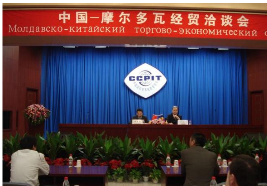
中国—摩尔多瓦经贸洽谈会

【双边磋商机制】1999年8月，中摩经济贸易合作委员会成立，双方签署了《中摩合作委员会工作条例》。2016年12月，中摩政府间经贸合作委员会第八次会议在基希讷乌举行，双方就加强两国经贸、金融投资合作达成一系列共识，还签署了关于中摩自由贸易协定可行性研究的谅解备忘录，宣布正式启动自贸协定联合可研工作。双方还就在两国经济技术合作协议框架下尽快落实铁路货运车厢和机场行李检测系统、太阳能电站和通讯指挥系统三个项目达成了共识。