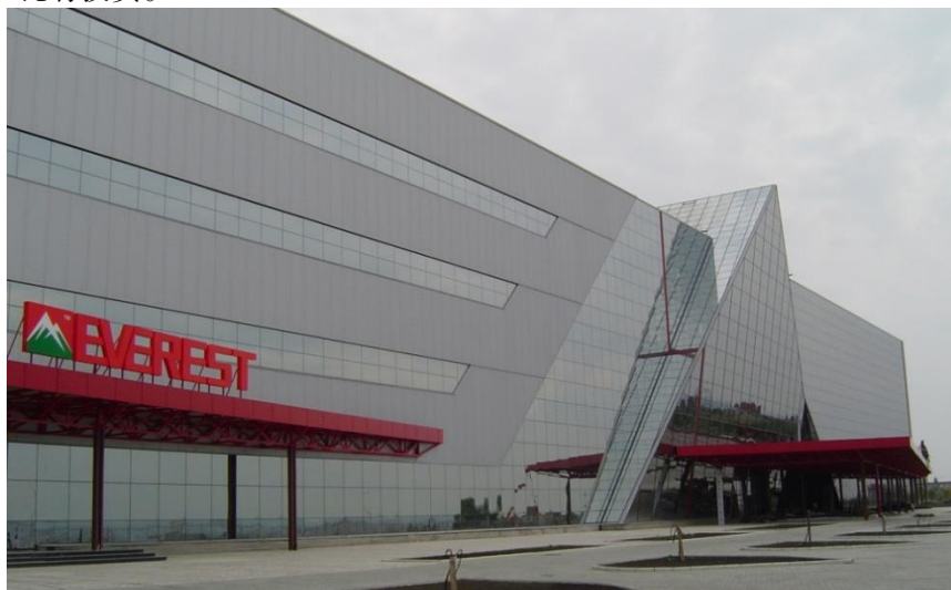
“三联”公司在摩尔多瓦投资的大型商贸综合中心