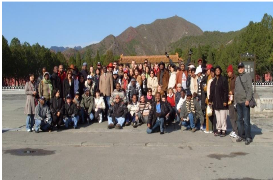
摩尔多瓦学员在华参加培训