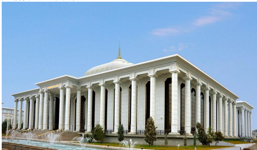
土库曼斯坦国民议会大楼

【总统】总统为国家元首、内阁主席、武装部队最高统帅，由全民直接选举产生，每届任期7年，可连任。2006年12月21日，首任总统尼亚佐夫去世后，土于2007年2月11日举行总统大选，别尔德穆哈梅多夫高票胜出，成为土独立后第二任总统。土库曼斯坦于2017年2月12日举行了总统大选，总统别尔德穆哈梅多夫高票再次连任，开始了第三个任期。下一次大选将于2024年举行。