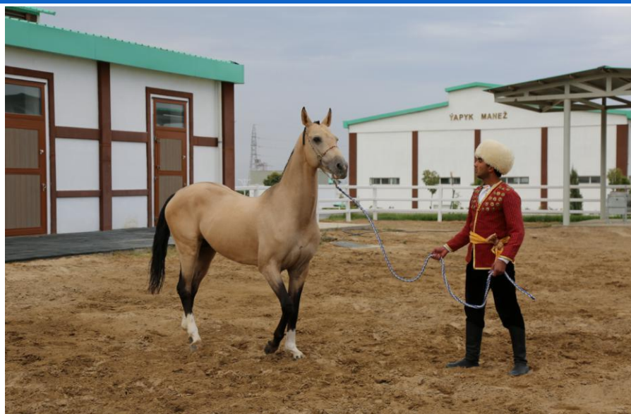
传说中的“汗血宝马”——土库曼斯坦国宝阿哈尔捷金马