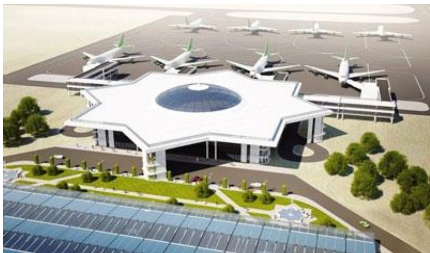
土库曼纳巴特市国际机场

土库曼斯坦境内有5个国际机场（阿什哈巴德国际机场、土库曼纳巴特国际机场、土库曼巴什国际机场、达绍古兹国际机场、马雷国际机场）和1个地方机场（巴尔坎纳巴特机场）。2016年9月17日，投资逾22.53亿美元新建的阿什哈巴德国际机场投入使用，该机场因候机大楼独特的“奥古兹汗八角形”屋顶设计被载入吉尼斯世界纪录。阿什哈巴德国际机场每小时旅客吞吐量近2000人次，每年可运输旅客逾1700万人次，年运输货物20万吨。土库曼纳巴特国际机场于2018年2月正式投入使用，机场造价4.77亿美元，每小时旅客吞吐量近500人次。马雷国际机场于2008年投入使用，每小时旅客吞吐量550人次。达绍古兹国际机场的3800米跑道、空中交通指挥塔、油库、停机坪等主体工程已建设完毕，造价2.09亿美元。土库曼斯坦正在建设列巴普州克尔基市新机场，造价3亿美元，占地200公顷，跑道长2700米，宽60米，航站楼面积1730平方米，每小时旅客吞吐量100人次。根据阿塞拜疆《趋势》网报道，截至2020年1月22日新机场即将完成跑道建设，预计2021年4月正式投运。中国与土库曼斯坦之间的定期往返航班有：土库曼斯坦航空阿什哈巴德—北京（每周2班），中国南方航空乌鲁木齐—阿什哈巴德（每周1班）。