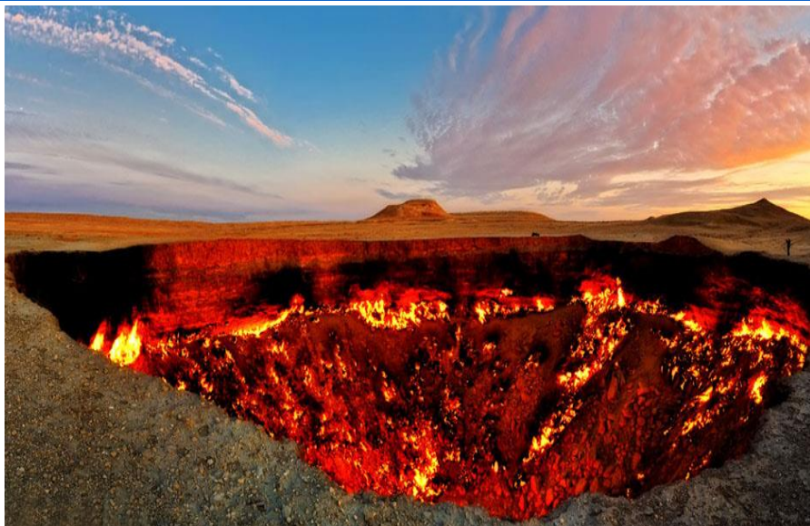
燃烧40多年的天然气坑—“地狱之门”