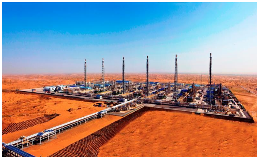
“复兴”气田一期第一天然气处理厂

【“一带一路”建设重要成果】互联互通建设取得重要进展。中国-中亚天然气管道已建成A、B、C线，连接土库曼斯坦、乌兹别克斯坦、哈萨克斯坦，规划中的D线拟以土库曼斯坦复兴气田为气源，计划途经塔吉克斯坦和吉尔吉斯斯坦。中国-中亚天然气管道为迄今中亚地区规模最大的输气系统。