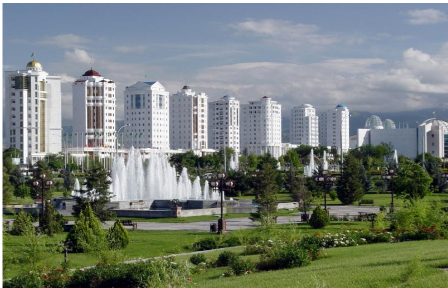
白色大理石城——土库曼斯坦首都阿什哈巴德

按照土库曼习俗，婚礼对土库曼家庭来说是一大盛事。土库曼人认为周二和周三举行婚礼不吉利，所以婚礼往往定在周末。婚礼当天要杀牛宰羊款待来宾。