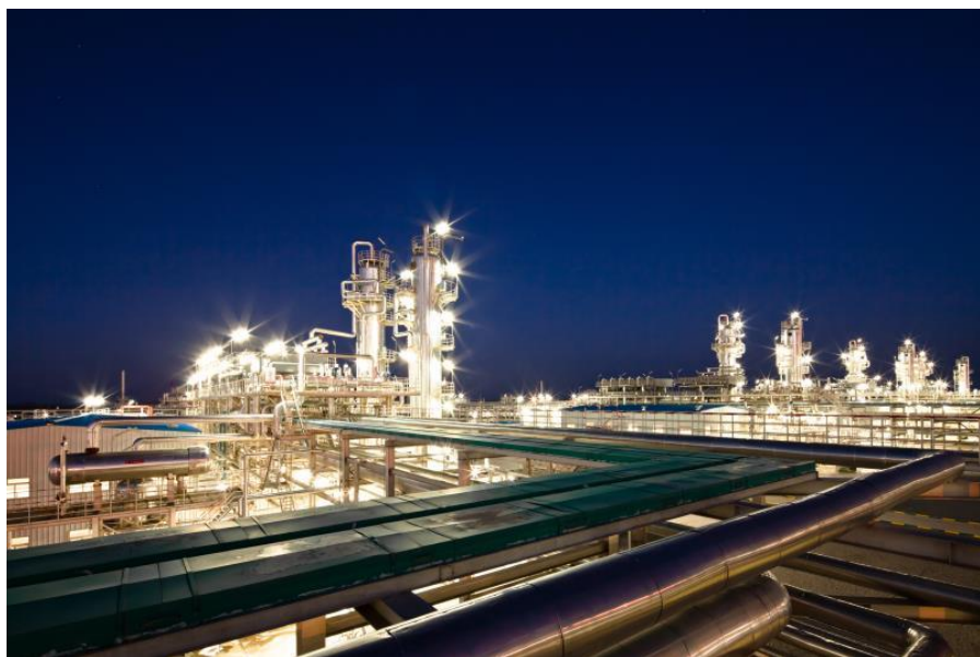
阿姆河右岸巴格德雷合同区第二天然气处理厂

中资企业在当地合作的重要项目包括：中油国际（土库曼斯坦）阿姆河天然气公司执行的土库曼斯坦阿姆河右岸产品分成合同项目、中国石油工程建设有限公司执行的巴格德雷合同区法拉普-瓦坦220千伏线路开关站项目、中国石油川庆钻探工程有限公司土库曼斯坦分公司执行的巴格德雷合同区钻井一体化服务项目、中国石油工程设计有限公司土库曼公司执行的巴格德雷合同区B区东部气田二期工程和中石化国际石油工程有限公司土库曼分公司执行的当地油井修复和钻井项目等。