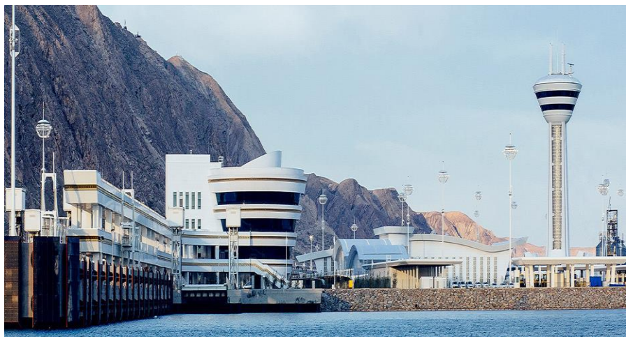
土库曼巴什新国际港口

口，土库曼斯坦西部的对外门户，可停靠7000吨货轮，是土库曼斯坦原油、成品油、聚丙烯等商品的主要出口通道。土库曼斯坦里海港口不仅是土通往其他沿岸国家的门户，还是中亚、伊朗等国家的贸易中转枢纽：货流可经土-俄之间的里海航线、从阿斯特拉罕港口（俄）进入伏尔加河内河航道、再经伏尔加-顿河航道出亚速海进而抵达黑海港口（暖季）；也可在土库曼巴什港通过轮渡至里海对岸的巴库港后，直接进入外高加索铁路网，进而从陆路抵达黑海的波季港（格鲁吉亚）。此外，土库曼斯坦与其他沿里海国家的港口—阿克套（哈）、阿斯特拉罕（俄）、马哈奇卡拉（俄）、巴库（阿塞拜疆）和涅卡（伊朗）之间均辟有油轮航运通道。2018年5月2日，土库曼巴什新国际港口正式投运，该项目造价约15亿美元，港区面积近152公顷，可以同时停靠17艘船舶。设计年货物吞吐量1700万吨（不包括石油制品），年客运能力为30万人次，年接驳货运汽车7.5万辆、集装箱40万个。港区内建有“巴尔坎”船舶修造厂，年修船或造船能力为1.2万吨。“里海-黑海”过境运输走廊是连接中亚与欧洲的最短、最经济路线。2019年3月，土库曼斯坦与阿塞拜疆、格鲁吉亚和罗马尼亚在布加勒斯特举行外长会议，探讨里海-黑海过境运输走廊建设，并签署《布加勒斯特宣言》。2018年，土水运货运量为210万吨，客运量12万人次。