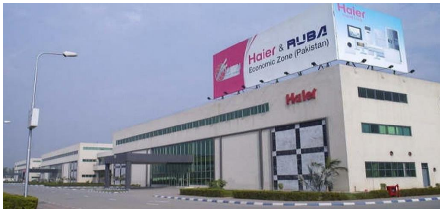
海尔鲁巴经济区厂区

于巴基斯坦第二大城市拉合尔，是中国商务部批准设立的首个“中国境外经济贸易合作区”，也是巴基斯坦政府批准建设的“巴基斯坦中国经济特区”，是中巴合作五年规划的重点项目之一。该区重点发展的产业为小家电及发电设备、汽车摩托车及配件、化工及包装印刷业等（详情可参阅 hrsez.haier.com ，电话：0532-88938290/8213，传真：0532-88938029）。