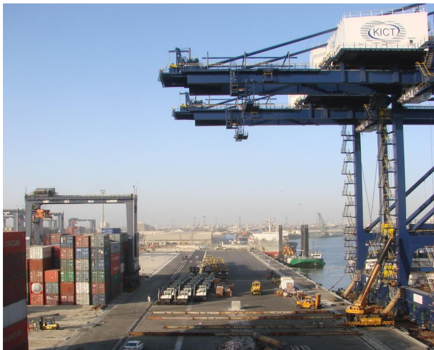
巴基斯坦最大的海港——卡拉奇港

由于印度河水源主要来自季风降水和北部高山冰雪融化，且流经沙漠地带，非汛期河水水位很低，加上沿河修建了一些大型水利枢纽工程，用于灌溉、发电和渔业，以致航运不便。因此，巴基斯坦内河水运很不发达，目前只有小船可在印度河下游通行。