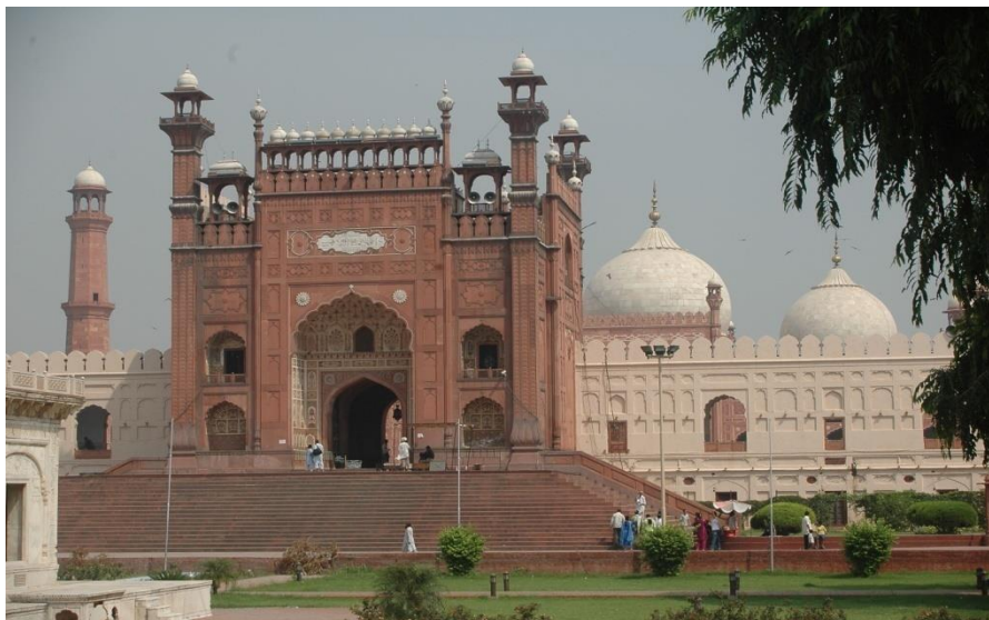
拉合尔市巴德夏希清真寺

巴基斯坦是穆斯林国家，严禁携带各种酒类、猪肉及猪肉制品等违反伊斯兰教义的物品入境。