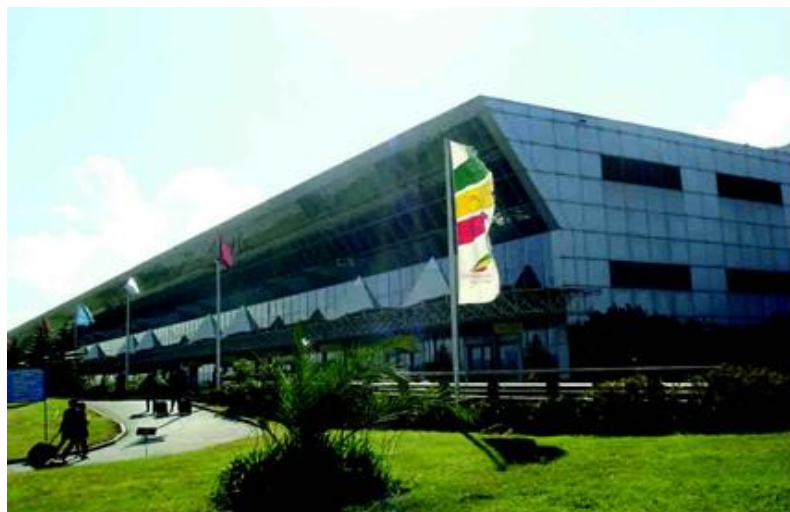
亚的斯博莱国际机场

埃塞俄比亚的航空业发展迅速，全国共有40多个机场，其中亚的斯亚贝巴、迪雷达瓦和巴赫达尔为国际机场。亚的斯亚贝巴宝利国际机场是东部非洲的空运中心，多年被评为“非洲最佳机场”，向15家航空公司提供地勤服务。埃塞俄比亚航空公司成立于1945年，营业收入和利润长年居非洲航空公司之首，多次获得“非洲最佳航空公司”奖项。截至2020年8月，埃塞俄比亚航空现拥有126架飞机，国际航线一百余条，国内航线21条，安全系数、管理水平和经济效益均佳。但受疫情影响，目前埃塞航空正常运营的航线仅有40余条。