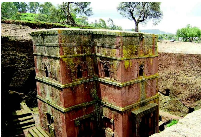
拉里贝拉岩石教堂

埃塞俄比亚居民中45%信奉埃塞俄比亚正教（基督教一性论教派），40%-45%信奉伊斯兰教，5%信奉新教，其余信奉原始宗教。