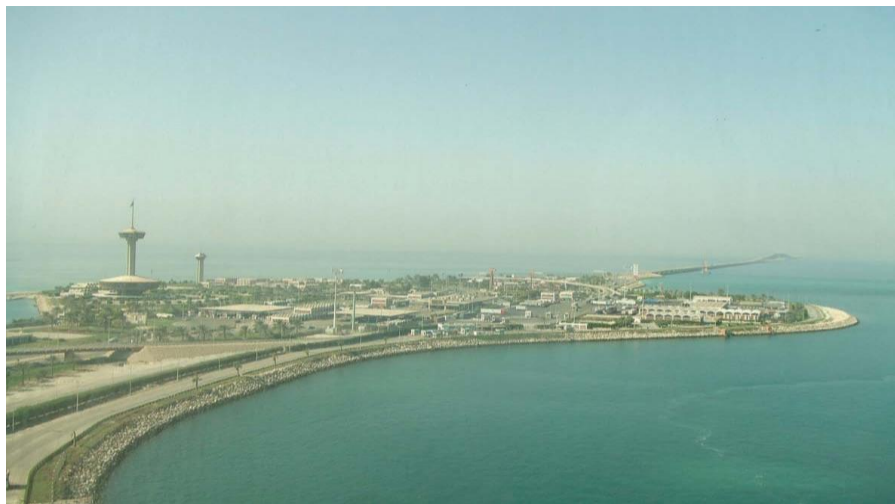
巴林沙特跨海大桥及海中人工岛