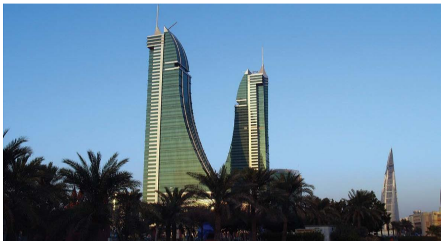
巴林金融港和世界贸易中心