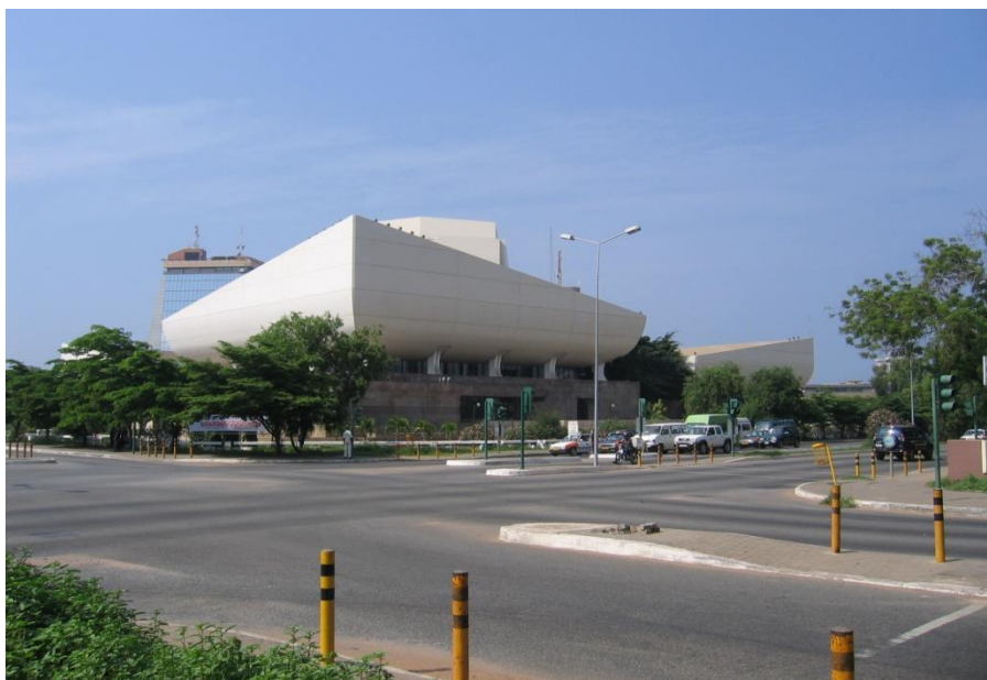
加纳首都标志性建筑——加纳国家剧院外景