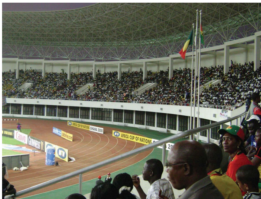
上海建工承建的用作2008年非洲杯比赛场地的体育场