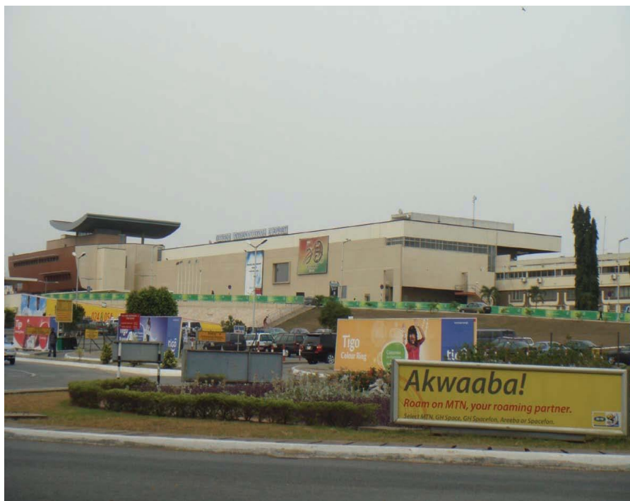
加纳科托卡国际机场