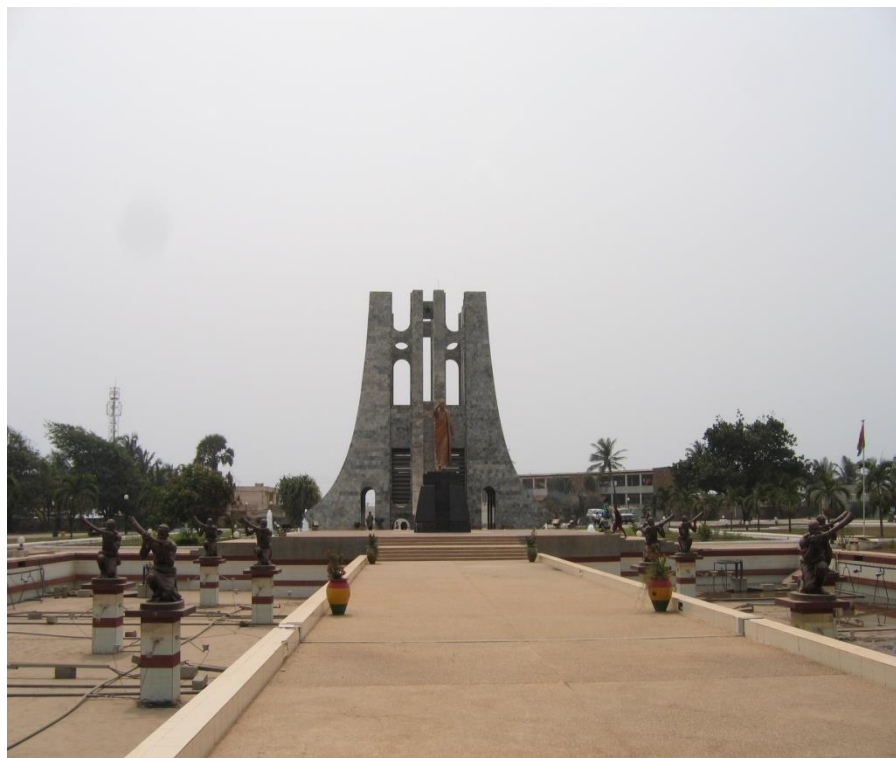
加纳标志性的名胜古迹——恩克鲁玛陵园

加纳海岸线长562公里，沃尔特河贯穿南北，渔业资源丰富。加纳森林覆盖面积约495万公顷，占国土面积的22%。