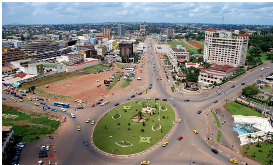
雅温得市中心“5·20”大道

(6) 改善税制，促进银行及小额信贷机构发展，加强国民储蓄的使用，实施可持续的债务战略，保障经济发展对融资的需求。