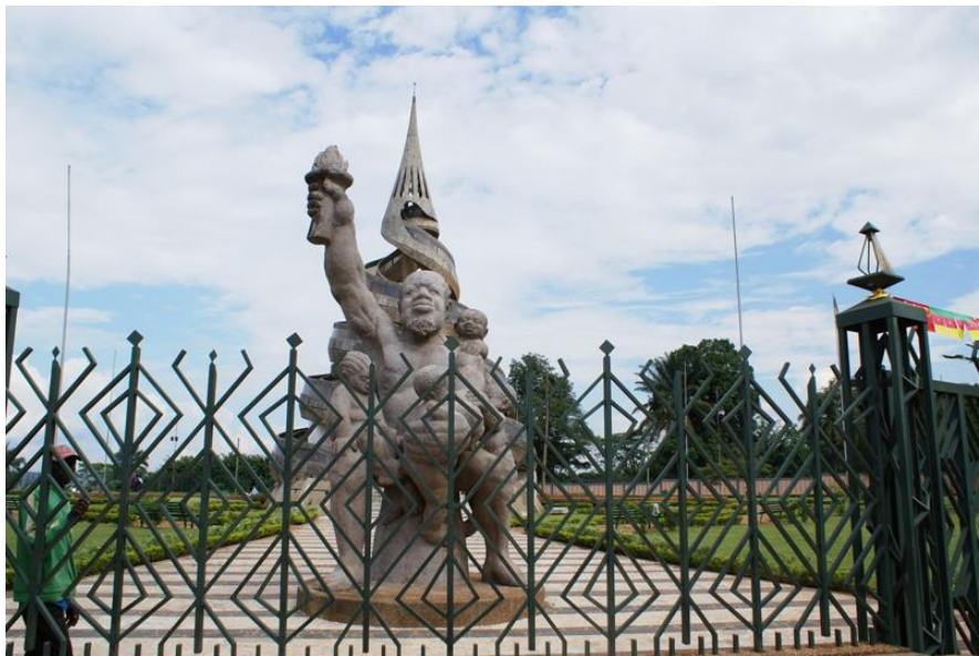
喀麦隆统一纪念塔

历史上，喀麦隆曾遭受德国殖民者的侵略，1884年沦为德国的“保护国”。第一次世界大战后，喀麦隆成为英国和法国的委任统治地。第二次世界大战后，喀麦隆成为英法两国的托管地。1960年1月1日，法国托管区根据联合国决议独立，成立“喀麦隆共和国”。1961年2月，英国托管区北部和南部分别举行公民投票，6月1日北部并入尼日利亚，10月1日南部与喀麦隆共和国合并，组成“喀麦隆联邦共和国”。1972年5月20日，喀麦隆公民投票通过新宪法，取消联邦制，成立中央集权的“喀麦隆联合共和国”，1984年1月改国名为“喀麦隆共和国”。